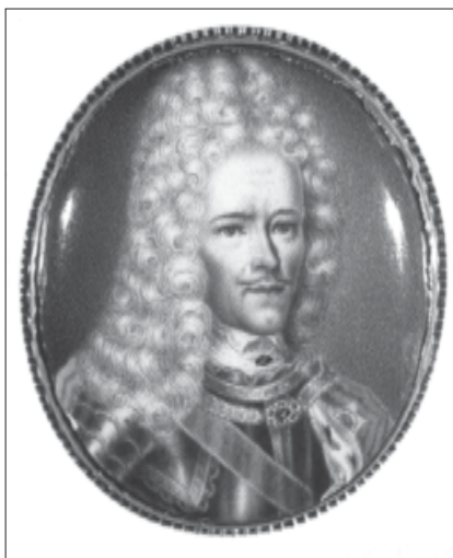
Портрет А.Д. Меншикова Живописец Г.С. Мушкетерский. 1709. ГЭ

светлейшему князю. Вероятно, он искренне полагал, что Петр I больше не нуждался в услугах украинского гетмана, равно как в Гетманщине и казачестве 39 . Но, помимо политических, безусловно, присутствовали и материальные соображения. За взятие Батурина и Полтавскую победу имения И.С. Мазепы, как российские (в Рыльском уезде), так и украинские, перешли в собственность Александра Даниловича, что сделало его вторым после Петра I помещиком Российского государства 40 .