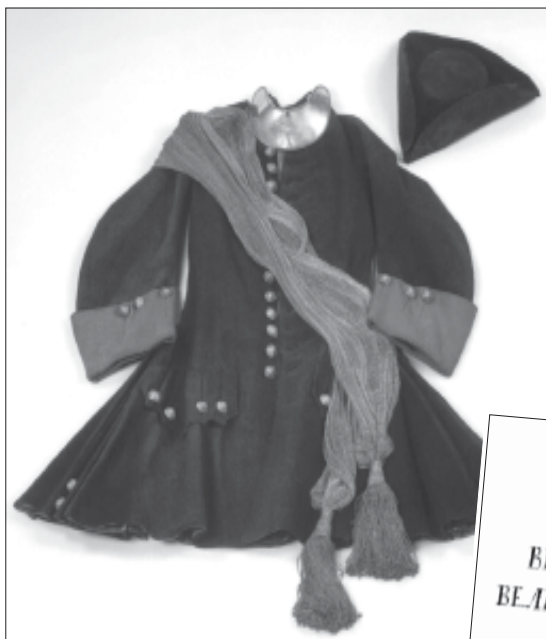
Мундир Преображенского полка, бывший на Петре I во время Полтавской битвы 27 июня 1709 г. Начало XVIII в. (до середины 1709 г.). ГЭ

Титульный лист рукописного сочинения П.Н. Крекшина «Журнал великославных дел великого государя императора Петра Первого, самодержца Всероссийского, содержащий в себе лето от первого дни Адама 7217, по Рождестве Иисус Христове 1709, собранный новгородским дворянином Петром Никифоровым сыном Крекшиным в царствующем граде Санкт-Петербурге в лето Спасительного воплощения 1753, от зачатия царствующего града Санкт-Петербурга 50». РГАВМФ