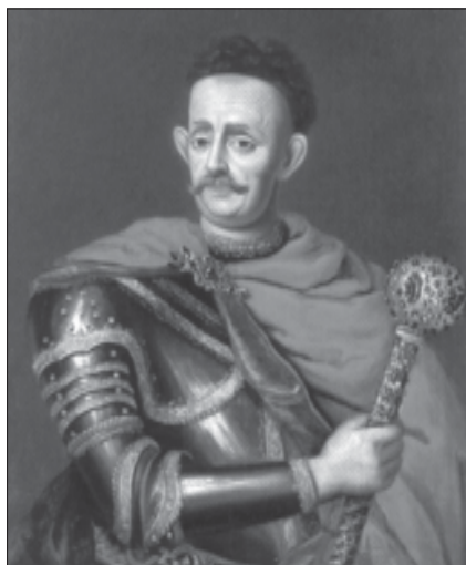
Портрет И.С. Мазепы кисти неизвестного живописца Начало XVIII в. Национальный музей, Стокгольм