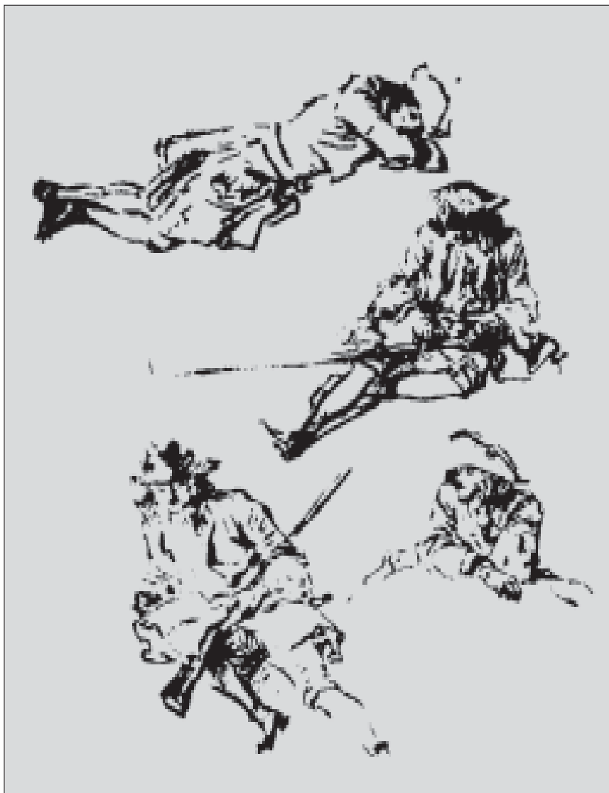
А. Ватто. Фрагмент этюда с изображением солдат. Рисунок. Начало XVIII в. Роттердам, Бойманс музей