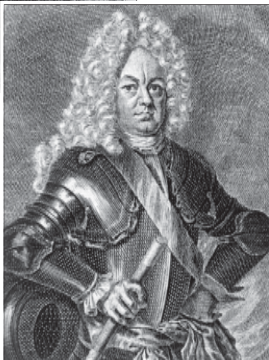
Неизвестный гравёр. Портрет Я.В. Брюса. 1712