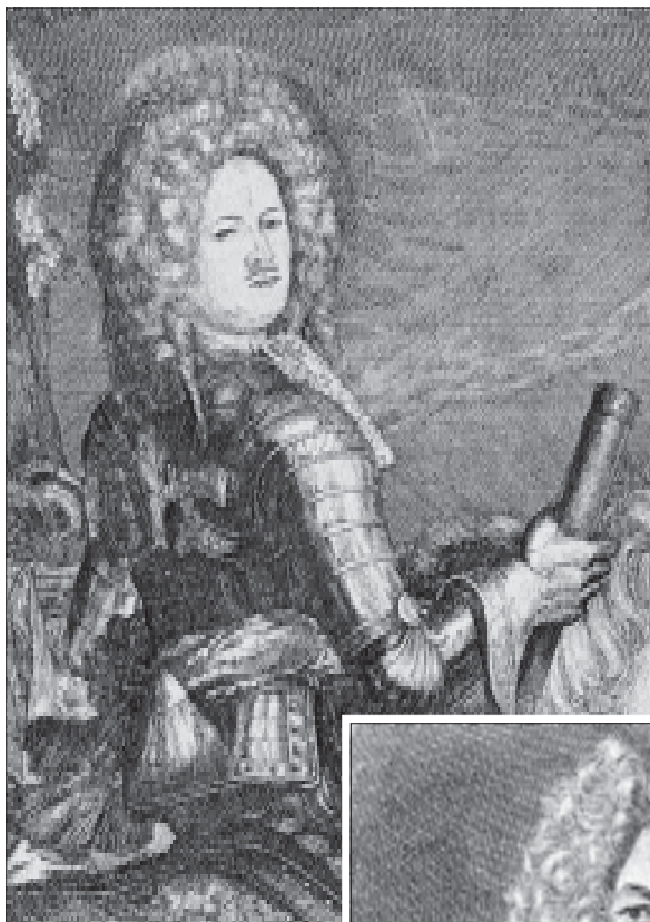
П. Пикарт. А.Д. Менишков на фоне сражения при Калише. 1707. Офорт. ГЭ. Фрагмент